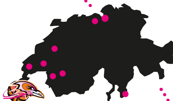
Les clubs suisses présents en LNAF